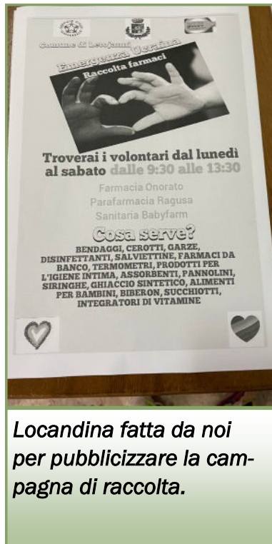
Locandina fatta da noi per pubblicizzare la campagna di raccolta.

Abbiamo partecipato alle attività di raccolta farmaci per l'emergenza in Ucraina. Ogni giorno ci posizionavamo davanti le farmacie e i supermercati per invogliare le persone a donare qualcosa per coloro che in questo tragico momento storico stavano attraversando una tragedia che nessuno si aspettava, dimostrando grande solidarietà, impegno e